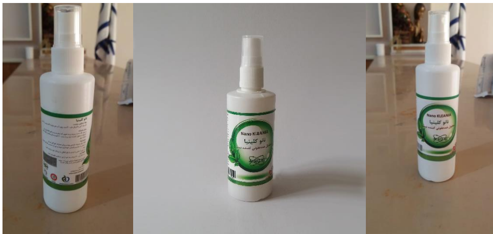
نانوکلینیا دست ۱۰۰ میلی لیتر

با تقدیم احترام رئیس هیئت مدیره مدیر عامل و عضو هیات مدیره شرکت آرمان جستجوگران انرژی نور شماره ثبت ۳۹۴۷۷ (ASEPE)