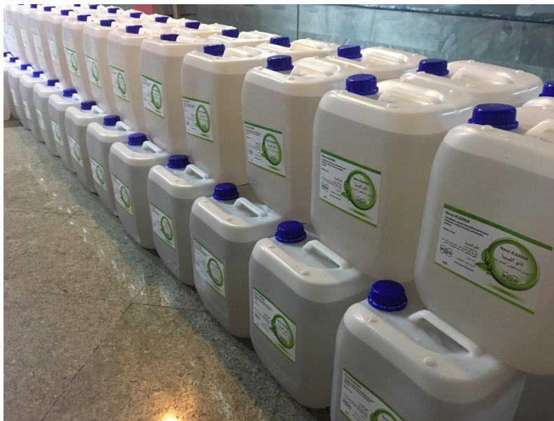
نانوکلینیا سطح و کف ۲۰ لیتری

با تقدیم احترام رئیس هیئت مدیره مدیرعامل و عضو هیات مدیره شرکت آرمان جستجوگران انرژی نور شماره ثبت ۳۹۴۷۷ (ASEPE)