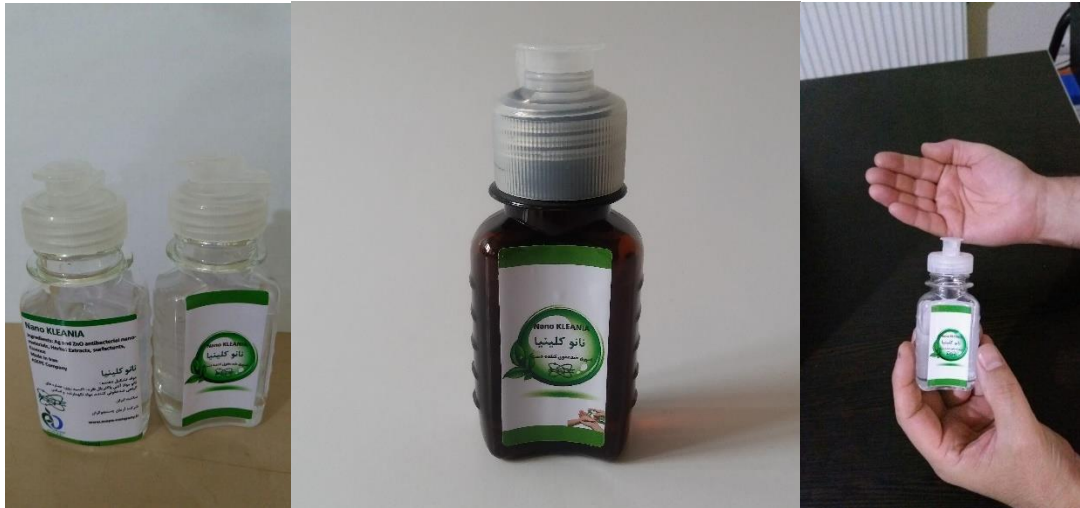
نانوکلینیا دست ۵۰ میلی لیتر

۵- نحوه بسته بندی و ارائه محصول: برای ارائه محصول فوق به دست مشتریان در مورد نانوکلینیا دست بسته بندی به صورت ۵۰ و ۱۰۰ میلی لیتری تهیه شده است. ولی اگر مشتریان عمده به صورت حجمی زیاد هم بخواهند در گالن های ۲۰ لیتری هم قابل ارائه است. نانوکلینیا سطح به صورت ۱ لیتری، ۴ لیتری و ۲۰ لیتری ارائه میگردد. نانوکلینیا برای پاشش روی کف به صورت ۲۰ لیتری ارائه میشود.