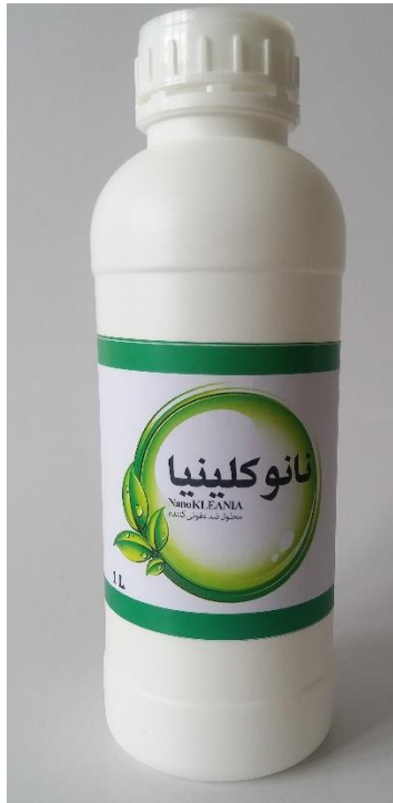
نانوکلینیا سطح یک لیتری